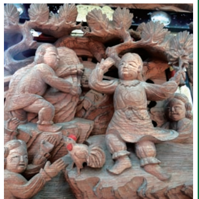
「天の岩戸」の図を彫った胴羽目