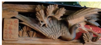
初代後藤義光刻銘と欄間彫刻