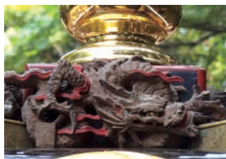
露盤に巻きつく龍の彫刻