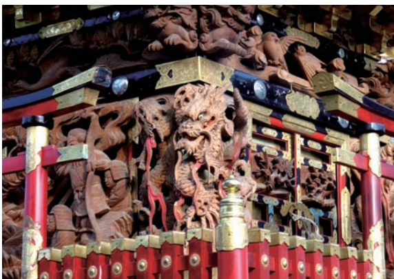
胴羽目、小脇、柱隠しと彫刻が並ぶ