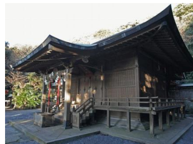
安房国一之宮 洲崎神社