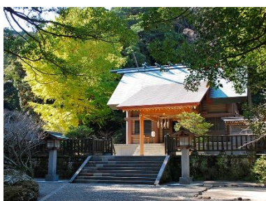
安房国一之宮 安房神社