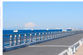
館山夕日桟橋(渚の駅たてやま) (海のマルシェ, なぎさ食堂)