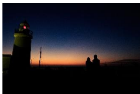
洲崎灯台 (森田屋商店)