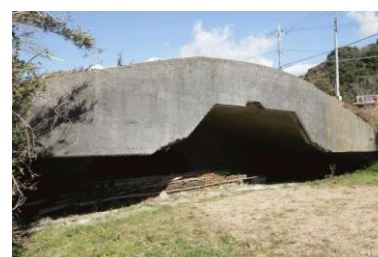
えんたいごう 掩体壕

館山市宮城字寺下 1 8 0 番地の 2 および 3 の一部 TEL : 0470-24-1911 (豊津ホール)