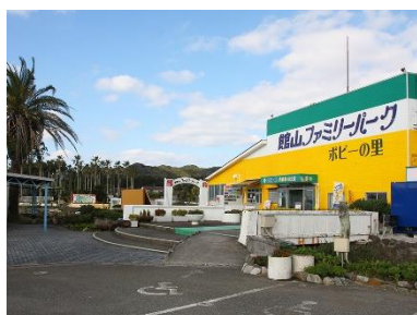
館山ファミリーパーク