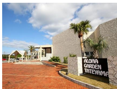
アロハガーデンたてやま