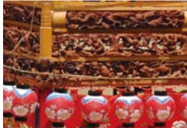
三段に連なるみごとな上高欄彫刻