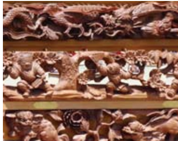
さまざまな題材の繊細な彫刻