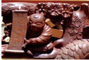
諏訪神社の巻物を持つ唐子彫刻