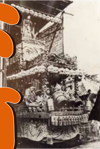
大正5年の下町山車と御仮屋