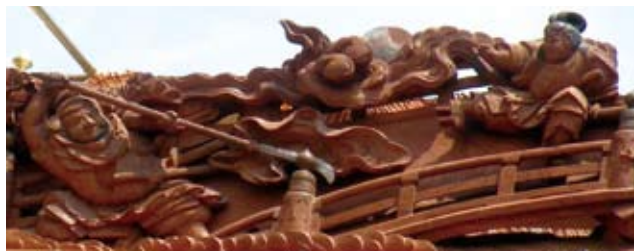
牛若丸と弁慶（囃子台上部）