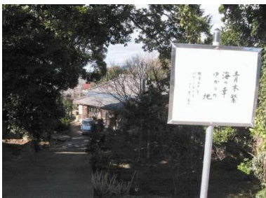
小谷家 青木繁「海の幸」記念館

開館日：土曜・日曜 開館時間：10時～16時 入館料：200円 小中高 100円 館山市布良 1256