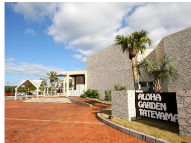
アロハガーデンたてやま