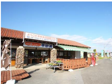
ふれあいショップ 平砂浦