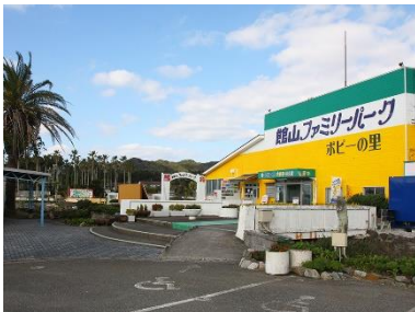
館山ファミリーパーク