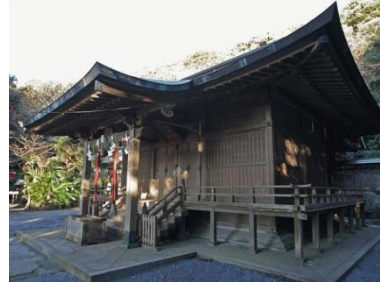
安房国一之宮 洲崎神社