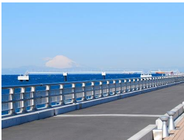
館山夕日栈橋 “渚の駅”たてやま