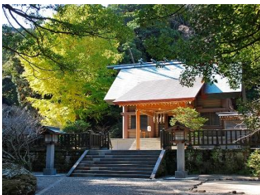
安房国一之宮 安房神社