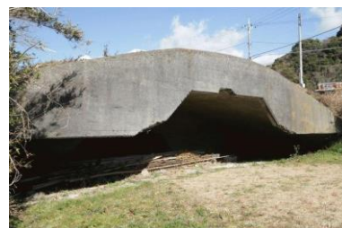
えんたいごう 掩体壕

館山市宮城字寺下 1 8 0 番地の 2 および 3 の一部 TEL : 0470-24-1911 (豊津ホール)