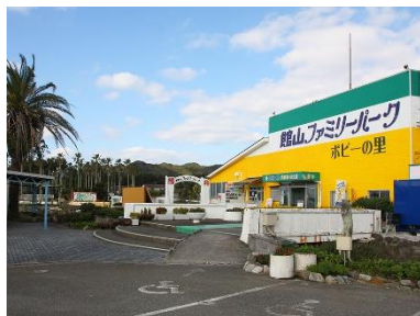
館山ファミリーパーク