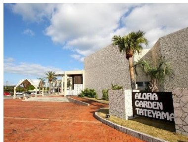
アロハガーデンたてやま