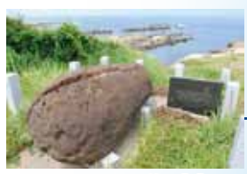
御神石 (ごしんせき)