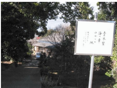
小谷家 青木繁「海の幸」記念館

開館日：土曜・日曜 開館時間：10時～16時 入館料：200円 小中高 100円 館山市布良 1256