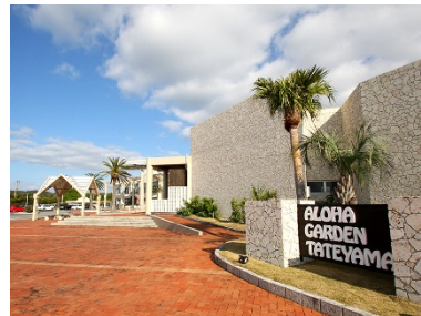
アロハガーデンたてやま