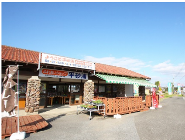
ふれあいショップ 平砂浦