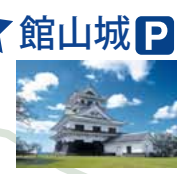
★ 館山城 P ♿