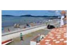
北条海岸 P ♿