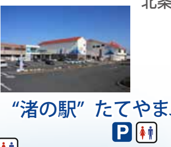
“渚の駅” たてやま P ♿