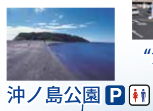
沖ノ島公園 P ♿